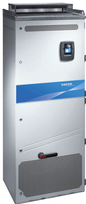
TABLA DE DATOS VARIADOR NXS FREE STANDING DRIVE FRAME 10

Tensión de Red 380 - 500 V 50/60 Hz, Enclosure NEMA 12 (IP55) Freestanding Drive